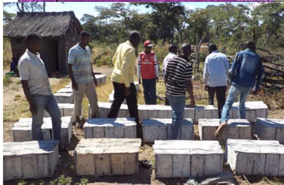
Apiculteurs d'INHBO et leurs ruches