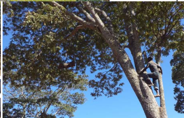
Apiculteur de Mwitikio allant récolter sa ruche.